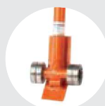
PALANCA ELEVADORA MODELO APAEL Pág. 67