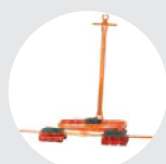
TANQUETAS DE TRANSPORTE MODELO ATACA Pág. 65