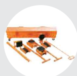
KIT DE TANQUETAS MODELO AKT Pág. 66